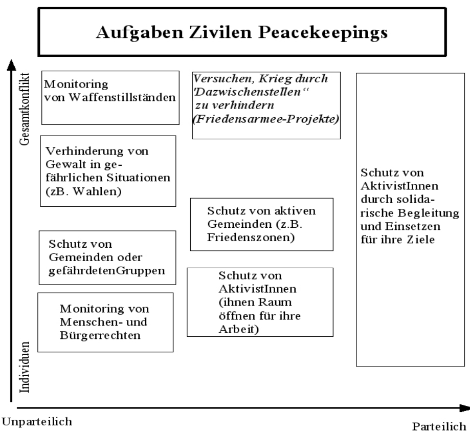
Bild 2 Aufgaben Zivilen Peacekeepings

Zwischen diesen beiden Extremen sind Projekte und Organisationen angesiedelt wie PBI oder das Balkan Peace Team in den 1990er Jahren, die sich als unparteilich ansehen und die argumentieren würden, dass sie nicht den Kampf derjenigen unterstützen, die sie begleiten, sondern dass sie vor Ort sind, um Menschenrechte zu schützen und dadurch Handlungsräume zu eröffnen.